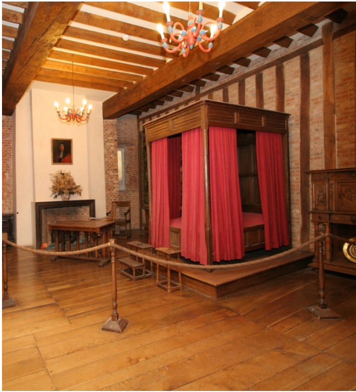
La chambre du seigneur

Nomme les différents éléments du mobilier