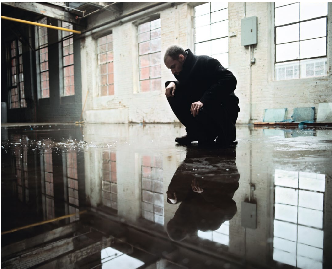
Sabine Meier, Narcisse (Portrait of a man) , 2011 © Sabine Meier.