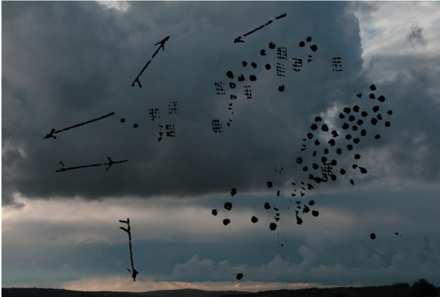
Orage, 2012-2016, données de l'Atlas météorologique de l'Observatoire impérial, 1868. Épreuve pigmentaire, dessin à l'encre de Chine, 24 x 36 cm