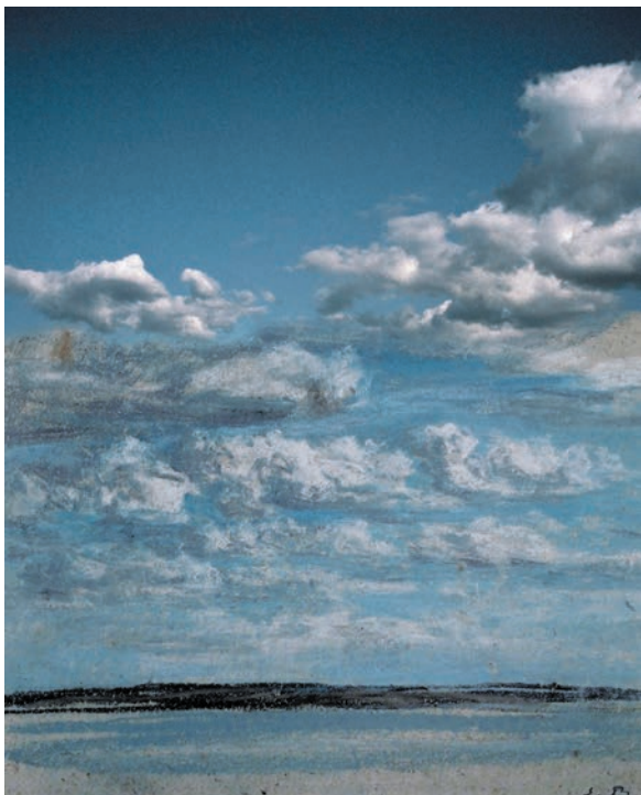
Ciel bleu avec Boudin, 2016 Épreuve pigmentaire, 50 x 40 cm (Nuages blancs, ciel bleu, musée Eugène Boudin, Honfleur)