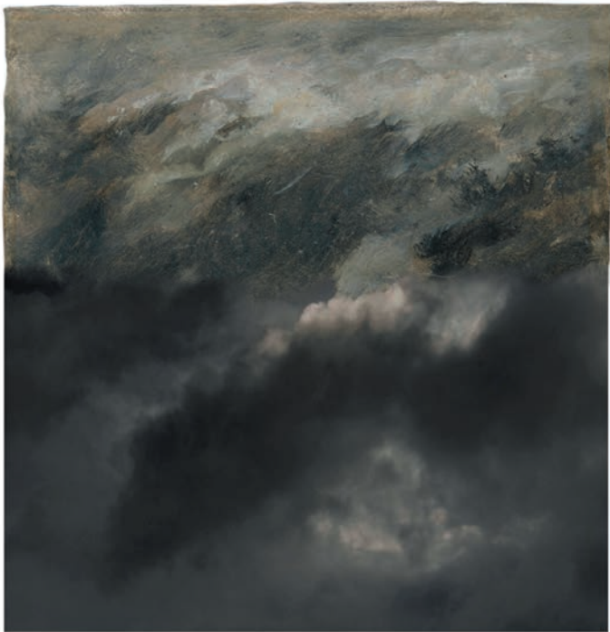
Ciel noir avec Boudin, 2016 Épreuve pigmentaire, 75 x 60 cm (Ciel pommelé, MuMa Le Havre) © Jacqueline Salmon