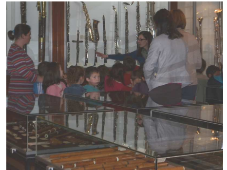
Une classe d'Ivry-la-Bataille en visite au musée, à la recherche d'indices sur le passé des fabricants d'instruments.

Les écoles des 4 communes concernées travaillent sur le sujet et contribueront à ces soirées lors d'une petite exposition proposée par l'association de valorisation du patrimoine de la commune en question. A La Couture-Boussey, c'est l'Association des Amis du musée qui remplira cette mission de valorisation. L'exposition sera visible dès 10h, le matin de la réunion publique.