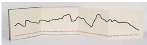
HAMISH FULTON Alps horizon, 1990 (détail du livre)