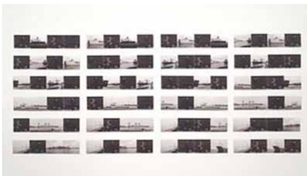
SUZANNE LAFONT Manœuvres , 2000