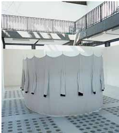
FABIEN LERAT Manteau , 1999