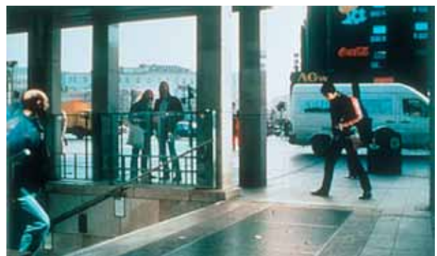
PHILIP-LORCA DICORCIA Berlin , 1997