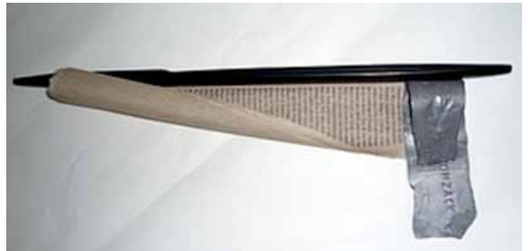
ANIK VINAY Tomzack , 1997