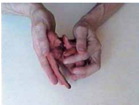
JAKOB GAUTEL Matière première , 1999