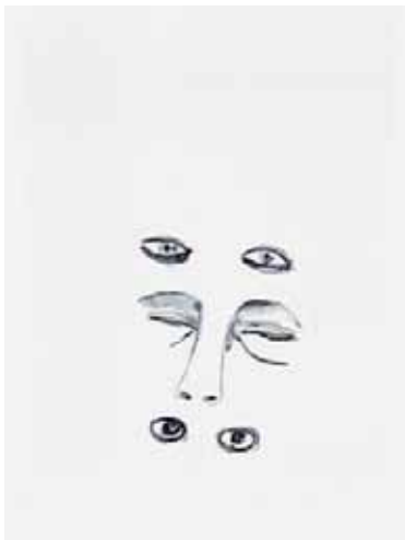
SILVIA BÄCHLI sans titre , 1996