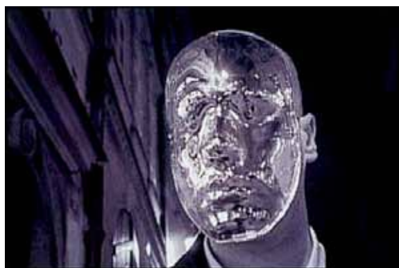
JAVIÈR PÉREZ Reflejos de un viaje , 1998