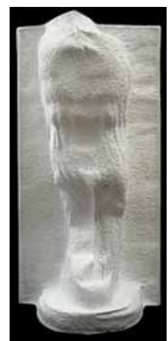
ALAIN SONNEVILLE D'après Eve, 1995 série des «empreintes de voyages», 1995