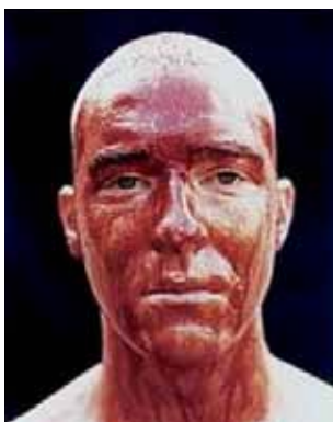
KENDELL GEERS Bloody Hell , 1990 MOTS CLÉS :