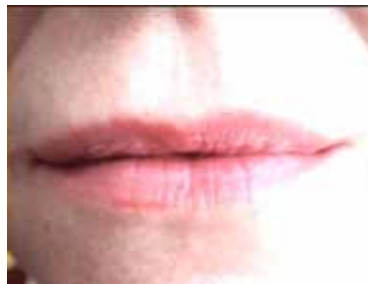
MARYLENE NEGRO Sourire , 1998