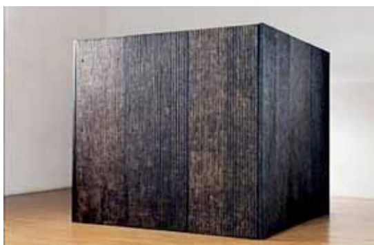
BERTHOLIN Element cubique , 1999