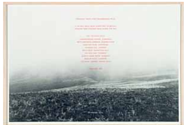
RICHARD LONG Dunkery Hill , 1985