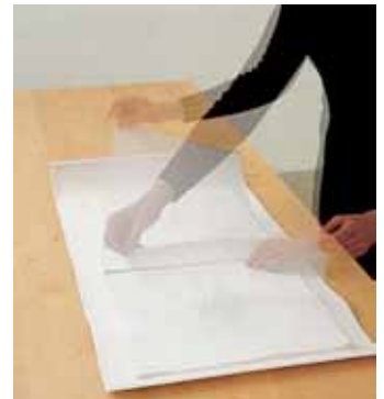
MARIE-ANGE GUILLEMINOT Le Mariage de Saint-Maur à Saint-Gallen , 1994