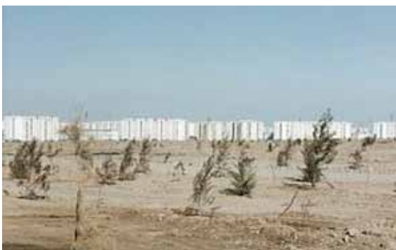
SOPHIE RISTELHUEBER Autoportrait (détail 2) , 1999