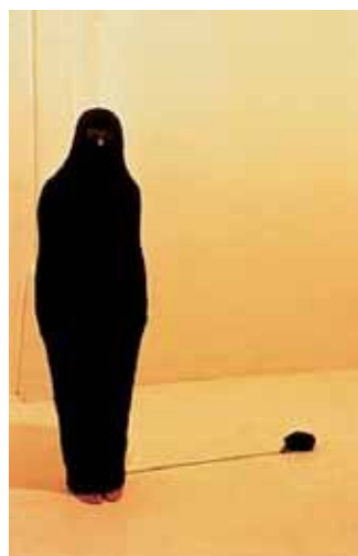
ADEL ABDESEMED Chrysalide, 1999