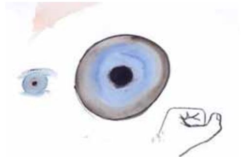
FABRICE HYBER , l'oeil , 2000