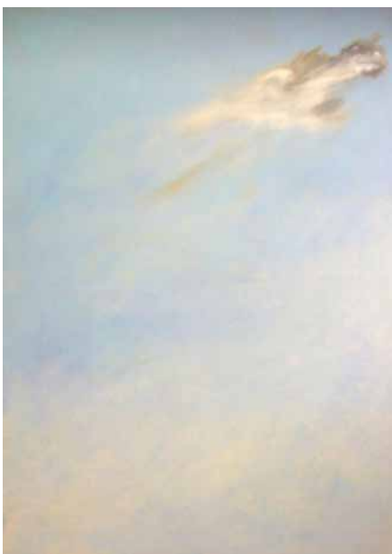
BRUNO CARBONNET Ciel, 2000