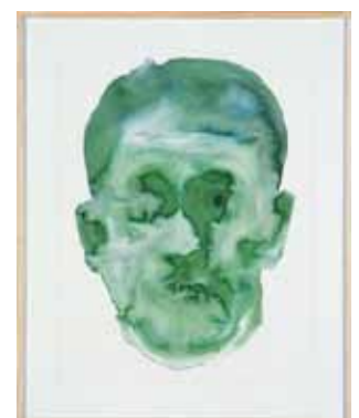
PHILIPPE COGNÉE PC9 , 1999 MOTS CLÉS :