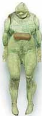
FABRICE HYBER P.O.F N°6 (prototypes d'objets en fonctionnement), 1994