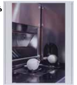
WOLFGANG TILLMANS Onion, 2010