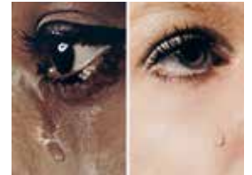
ANNE COLLIER Woman Crying #8 et #7, 2016