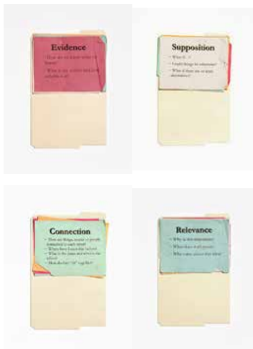
ANNE COLLIER Relevance, Supposition, Connection, Viewpoint, Evidence , 2011