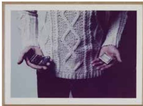
MAURIZIO NANNUCCI Sept Rotations 1-6, 1979