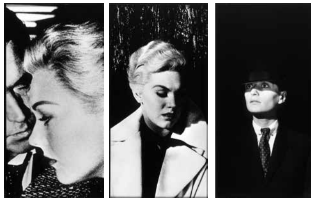
VICTOR BURGIN extrait de l'album The Bridge , 1983-1984