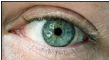
DOUGLAS GORDON Sans titre, 2000