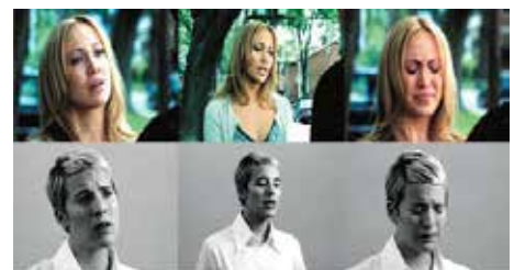
CANDICE BREITZ Becoming, 2003.