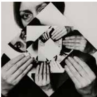
DORA MAURER Sept Rotations 1-6, 1979