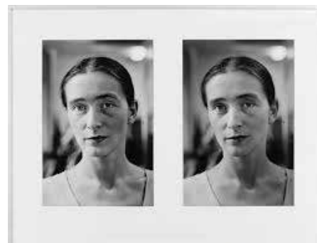
TIMM RAUTERT Pina Bausch, 1972