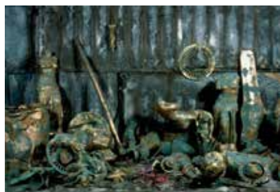
PASCAL KERN Fiction colorée, 1984