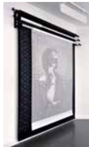
ISABELLE LE MINH Piercing, 2015