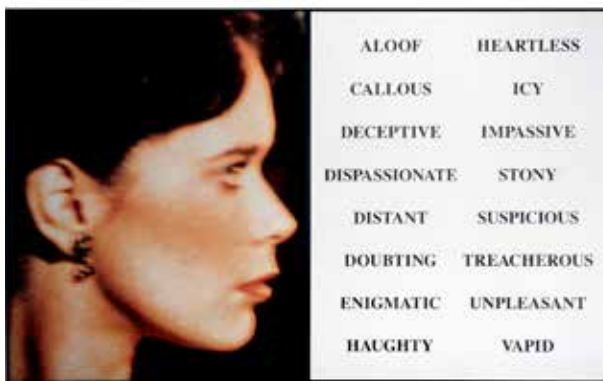
JOHN BALDESSARI Prima facie (third state) From Aloof to Vapid, 2005