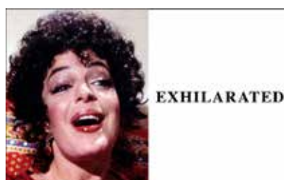
JOHN BALDESSARI Exhilarated , 2005