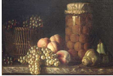
ANONYME Nature morte aux fruits et bocal - 18 e siècle