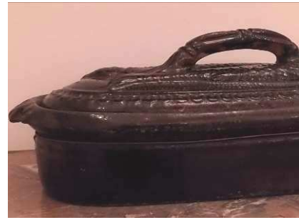
Plat à terrine de poisson Terre brune émaillée - 18 e siècle ?