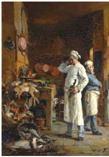
BERGERET Pierre Denis Le cuisinier embarrassé 19 e siècle