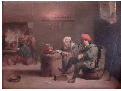
TENIERS David II (attribué à) Intérieur, fumeurs et musiciens – 17 e siècle