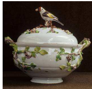
Sopièrre Faiènce – 19 e siècle