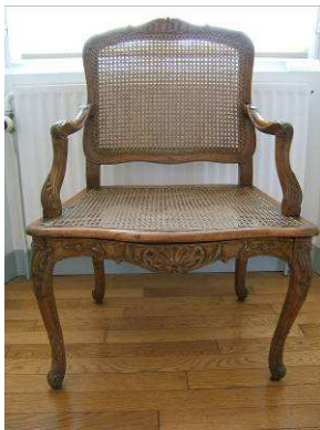
Fauteuil régence canné Bois - 18 e siècle