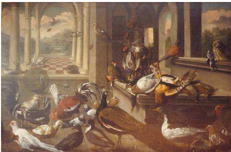
BOUILLON Michel Oiseaux et gibiers - 17 e siècle