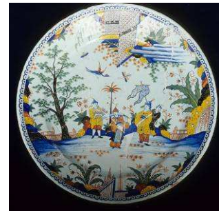
Assiette aux chinois Faiènce – 18 e siècle