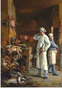
BERGERET Pierre Denis Le cuisinier embarrassé 19 e siècle