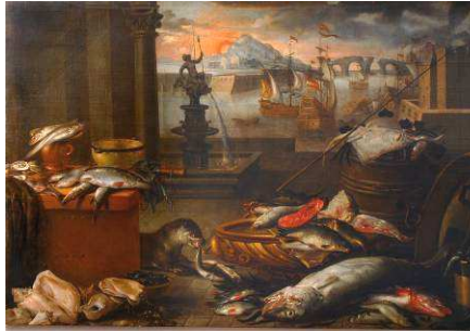
BOUILLON Michel Poissons - 17 e siècle