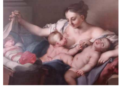
CIGNANI Carlo La charité - 17 e siècle