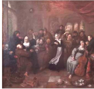
BRAKENBURG Richard Moines et religieuses en goguette - 17 e siècle