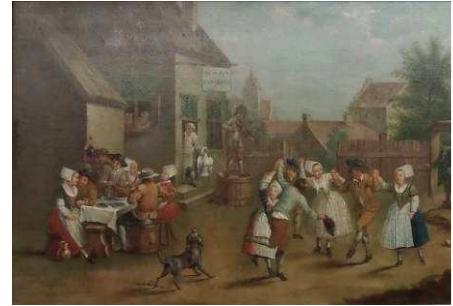
ANONYME Mon oye fait tout - 17 e siècle