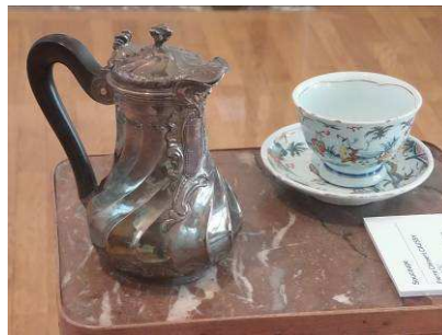
Verseuse marabout Argent – 18 e siècle