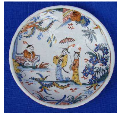
Assiette aux chinois Faïence – 18 e siècle