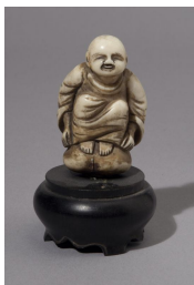
Personnage japonais Japon, fin XVIIIes

Catalogue d'exposition en vente au musée