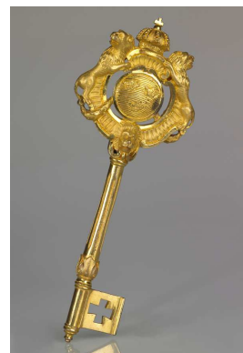
Clef de Chambellan aux armes de Suède, XVIII e siècle, laiton doré au mercure