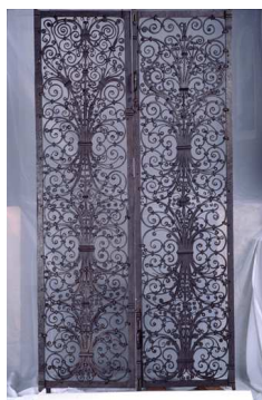
Porte du chœur de l'église d'Ourscamp, 1202, fer forgé