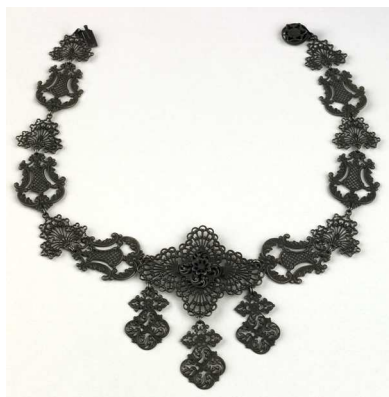
Collier à motif de lyre début XIX e siècle, fonte de Berlin