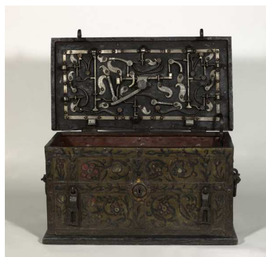
Coffre dit de Nuremberg, XVII e siècle, fer forgé, découpé, repris au ciseau, assemblé par rivets et par vis et peint