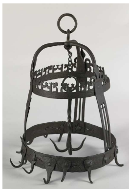
Couronne d'office XV e ou XVI e siècle, fer forgé découpé et riveté